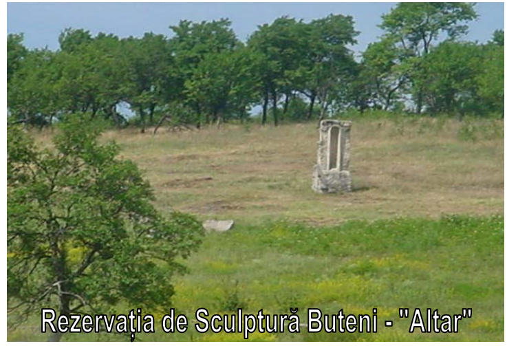
Rezervația de Sculptură Buteni - "Altar"