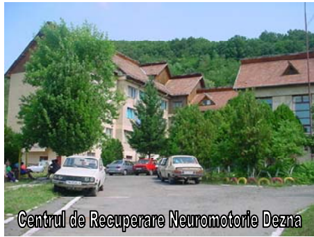
Centrul de Recuperare Neuromotorie Dezna