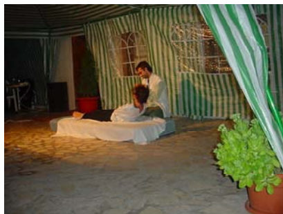
Secvență din spectacolul cu piesa „Veronika se hotărăște să moară” de Paulo Coelho